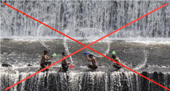
Foto dibawah ini mengkonfirmasi bahwa gambar anak laki laki yang melempar air adalah “pengaturan,” (“staged”)

Gambar dari acara atau kegiatan yang diatur khusus untuk fotografi atau subjek yang diarahkan atau