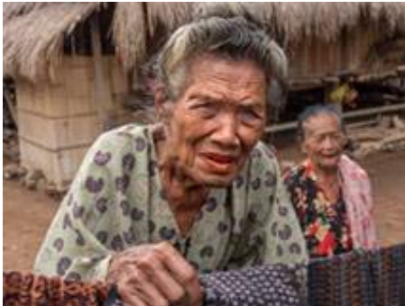
Photo Travel ပုံတစ်ပုံဟာ နေရာဒေသ တစ်ခုမှာ ရှိနေတဲ့ လူနေမှု စနစ်၊ မြို့ပြ/ ကျေးလက် လူနေမှု စနစ်တွေကို အရှိကို အရှိအတိုင်း ဖော်ပြရပါမယ်။ ပထဝီ အနေအထားအရ ကန့်သတ်မှု ရှိစေမယ့်ပုံ မဖြစ်စေရဘူး။

Photo Travel ရဲ့အဓိပ္ပာယ်ဆိုလိုရင်းကို ဥပမာပုံနှင့်တကွ အောက်တွင် အနီရောင်ဖြင့် highlight လုပ်ထားပါသည်။